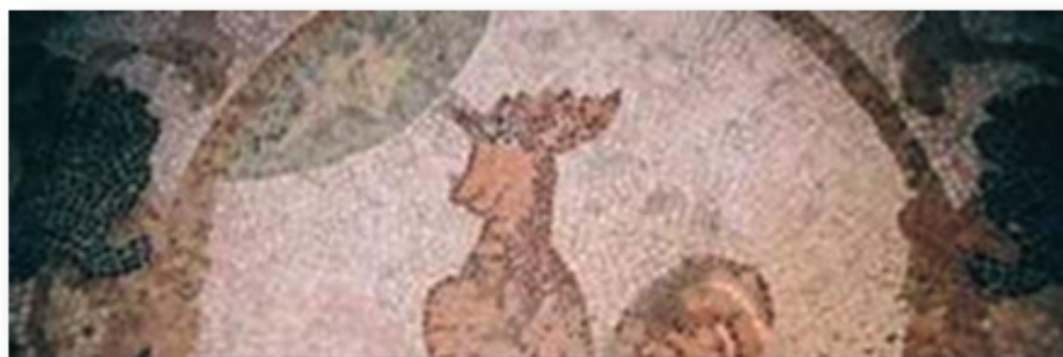
(L'immagine in alto fotografa un dettaglio dello stemma dei Principi Gallone (Signori di Tricase) riprodotto sul pavimento a mosaico della Sala del Trono del loro Palazzo. Il gallo, emblema della Famiglia Gallone, canta a Venere, la stella del mattino che, con il raggio più lungo, indica il punto dal quale sorgerà il sole, anticipandone il levarsi. Anche oggi lo stemma della città è costituito da tre cose, un pino ed una Stella, quella del mattino).

Il simbolo del Porto Museo di Tricase, dell'ecomuseo di Venere, è una stella a cinque punte, con una allungata verso il basso a sinistra dell'osservatore e, simboleggia Venere. Perché è a Venere, il pianeta, la stella del mattino, quella che anticipa il sorgere del sole, che gli abitanti di questo piccolo borgo del Salento levantino, principi e plebei, marinai e terrazzani, hanno continuato nei secoli ad affidare le loro speranze e le loro ambizioni, chiedendole protezione, in terra ed in mare.